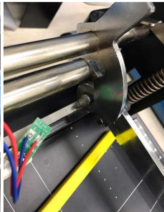
バー下がってる状態