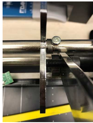
横からのピンに引っ掛かります

※ここでプレートが歪んで曲がっていないかピンにきちんと引っ掛かるか確認してください。